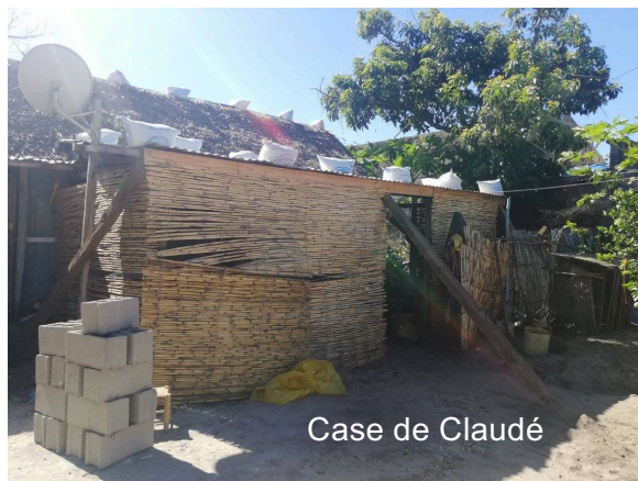
Renforcement des cases et infrastructures avant l'arrivée de FREDDY dans le district de MANANJARY